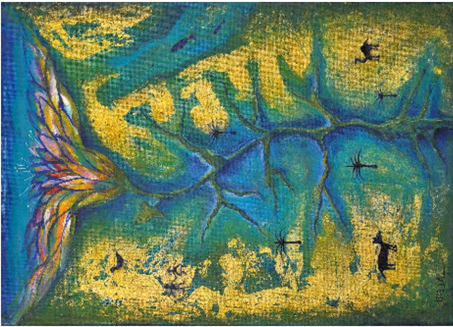
„Wasserströme in der Wüste“ Weltgebetstag aus Ägypten am Freitag, den 07. März 2014 19:00 Uhr mit anschließendem Essen im Stangengrüner Pfarrhaus.